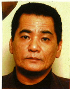
平成15年当時の写真